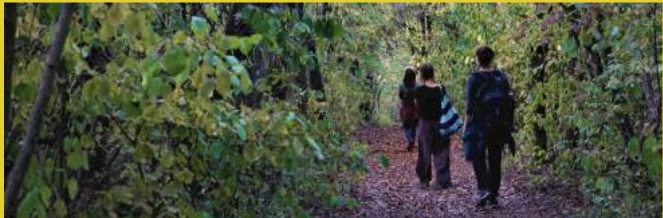
Caminhar pela Paisagem - Formação de Catalisadores Comunitários, Hungria 2019

O WeLand é um ciclo de cinco fases que flui através de práticas que dão sentido ao lugar e se tornam modos de vida regenerativos. Move-se a partir de uma conexão holística com a paisagem num amplo diagnóstico sensorial, visando o envolvimento profundo entre a comunidade, a terra e uns com os outros. Isso cria uma confluência de entendimento que dá nome à identidade de um lugar. Emergindo dessa fase de nomeação, os atores-chave voltam a envolver a comunidade no co-design do seu futuro. Ideias cristalizam e são testadas. Novas informações são recolhidas e agrupadas à medida que a interação com a paisagem se aprofunda, refinando a identidade através de um processo iterativo contínuo. O WeLand pode acontecer simultaneamente a várias escalas e através de múltiplos projetos em interação.