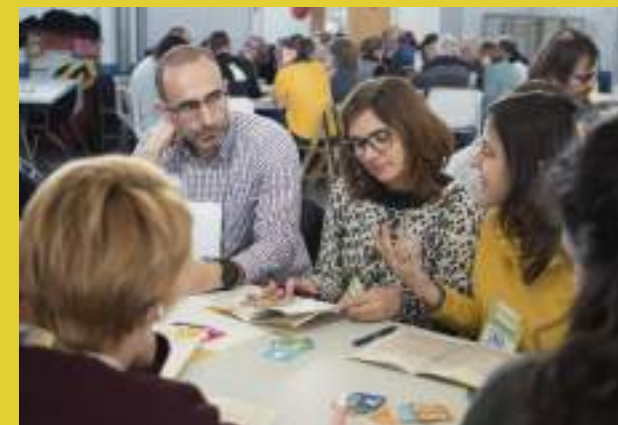
Reunião de Territórios, Resilience Earth 2018