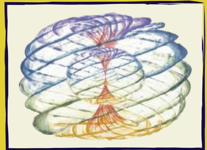
Torus WeLand integrados, OrlaDesign 2015

O vórtice toroidal é um padrão universal amplamente observado na natureza, auto-organizando-se em contínuo movimento.