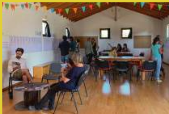
Reunião Comunitária, OrlaDesign 2019