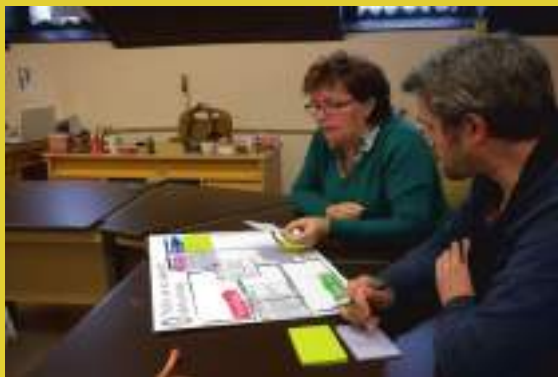
Entrevistas com canvas dos ODS, Profiantrop 2019