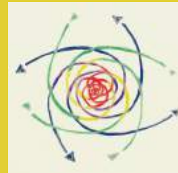
Secção-corte de Torus, OrlaDesign 2014

O vórtice toroidal é um padrão universal amplamente observado na natureza, auto-organizando-se em contínuo movimento.